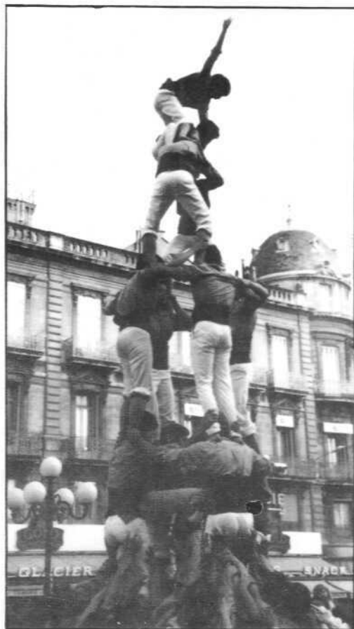
4 de 6 amb agulla a Montpeller