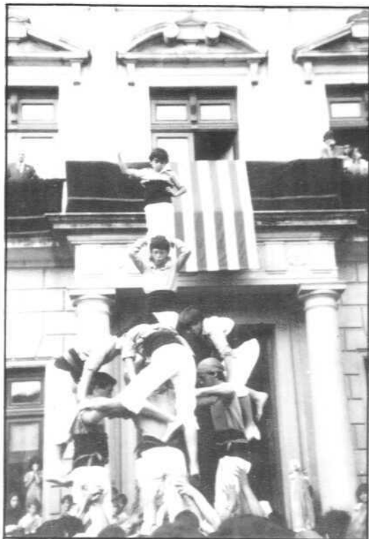
4 de 6 amb agulla per Festa Major

L'any passat per la diada de Festa Major havíem aconseguit tres estructures de set, una de les quals era carregada i en tota la temporada en vam fer dotze. Enguany, per la mateixa data ja hem aconseguit vuit estructures de set (set de descarregades i una de carregada), i se'ns presenta un final de temporada, teòricament, amb possibilitats d'aconseguir algun altre castell nou. I fixeu-vos bé que he dit teòricament, perquè de la teoria a la pràctica hi ha quelcom més que un pas i no es podrà dir que avancem, malgrat que ho sembli, fins que, per exemple, poguem aconseguir una major i més regular assistència als assajos. No ho podem fer sino aconseguim molta més gent per a la colla. No estarem consolidats fins que, com molt bé diu el President en la seva carta, les futures generacions portin amb orgull la camisa dels Xiquets de Reus.