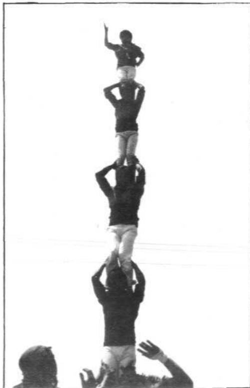
Pilar de 5 a Barcelona