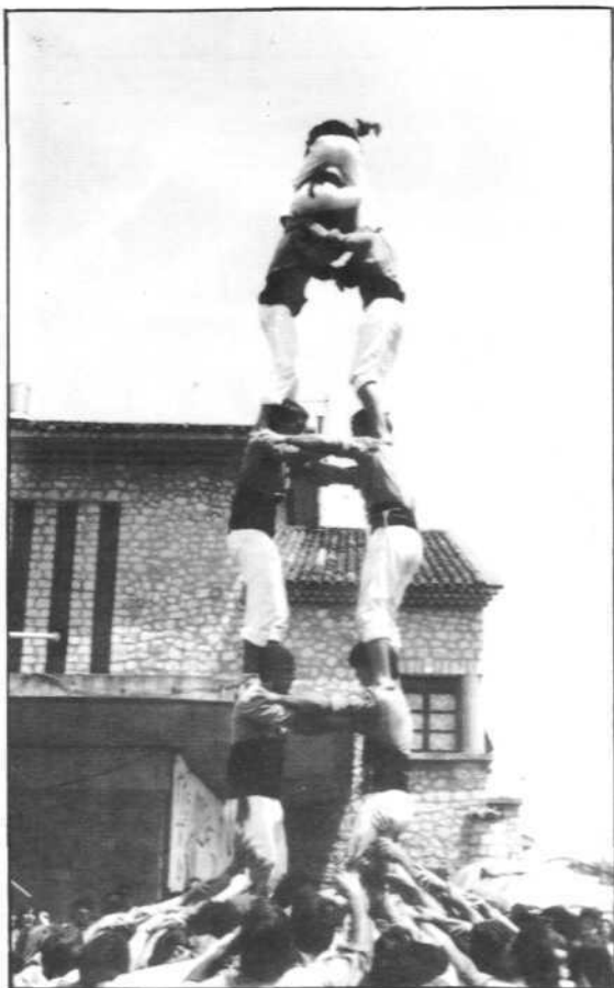
2 de 6 a la Festa del Vi de Cournouteral