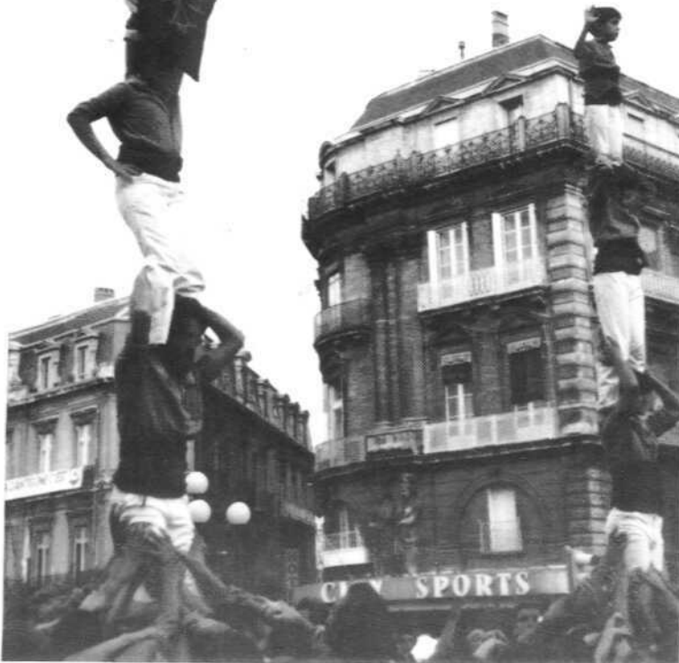
2 pilar de 4 a Montpeller