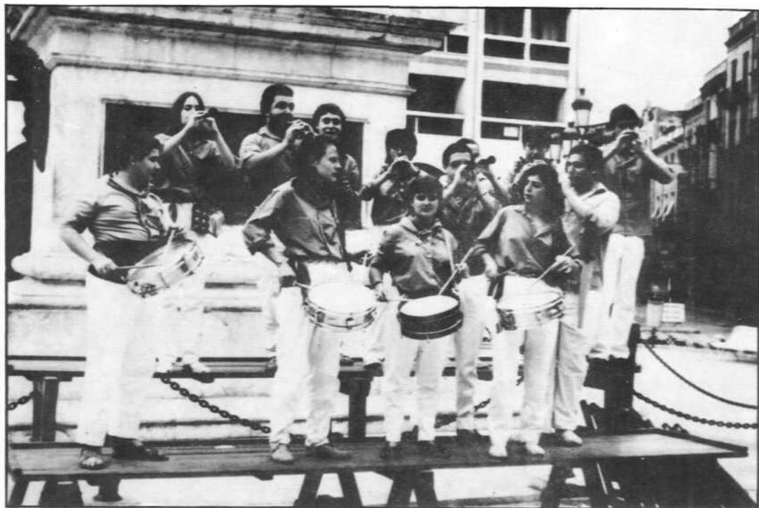
Els grallers de la Colla a les matinades de Festa Major