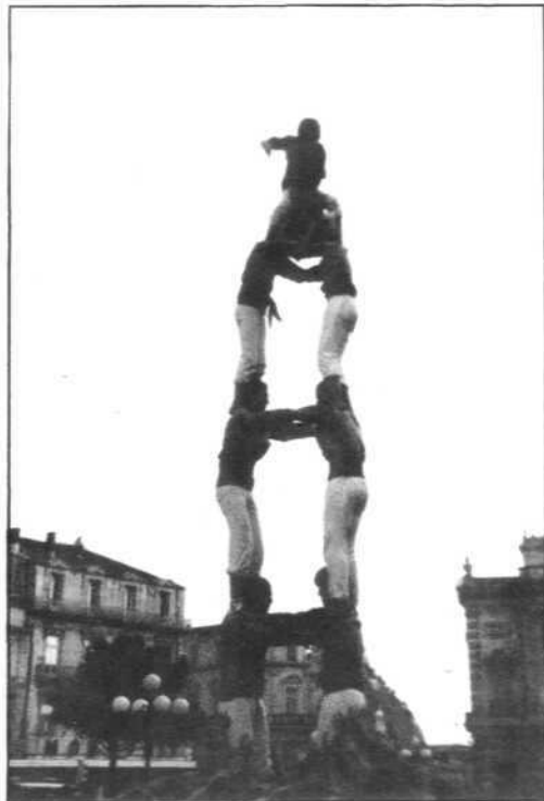
Torre de 6 a la Plaça de la Comédie de Montpeller

Després d'una petita recepció, vàrem dinar i poder descansar un bon ratet, fins l'hora de l'actuació; que férem entrada amb un pilar caminant fins davant la porta de la Cave Coopérative on vam fer tots els castells restants. Dos de sis, descarregat, tres de sis net, i que cal remarcar el moment en què l'anxaneta feu l'aleta i els formants de la pinya s'acotxaren, mentre el públic feia un divertit i clamorós OOOOH!!!!. Tot seguit es va descarregar el quatre de sis amb l'agulla i el pilar de cinc, i per acabar tornarem a fer els dos pilars de quatre amb les senyeres catalana i Occitana.