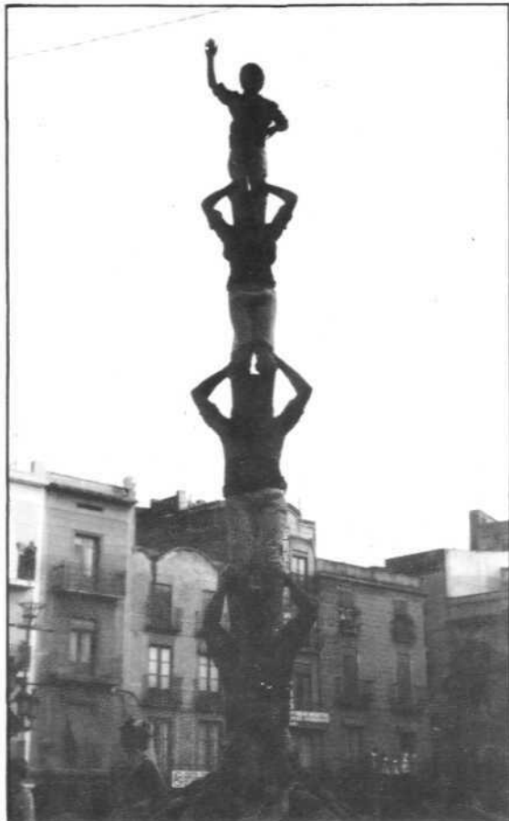
Pilar de 5 aixecat per sota. Festa Major 1.984