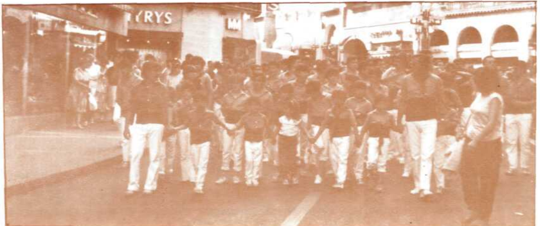
Cercavila per la ciutat de Montpeller

S'està gestant a la nostra ciutat el Club de fans dels Xiquets de Reus. Les condicions per ésser-hi admès no són massa complicades i la seva seu és a la Plaça Mercadal els dies d'actuació. Ocassionalment aquesta seu es trasllada a d'altres indrets de la població i fins i tot a d'altres localitats. El nom que adoptarà el grup segurament serà el de: "El Coixí". Interessats adreceu-vos a qualsevol actuació de la colla per allà on munten els castells.