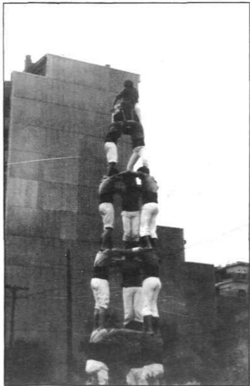
3 de 7 al Clot (Barcelona)