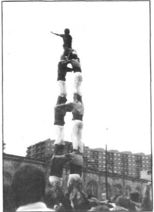
2 de 6 al Clot (Barcelona)

En fi que des d'aquestes ratlles volem manifestar de bell nou i davant de tothom la nostra ferma voluntat de fer dels XIQUETS DE REUS una entitat amb ARRELS Arrels al poble, a la comarca i al país. I des de Paleta es pot també treballar en aquest sentit. Tan sols falten com en un tres de set o un pilar de cinc MANS!!!