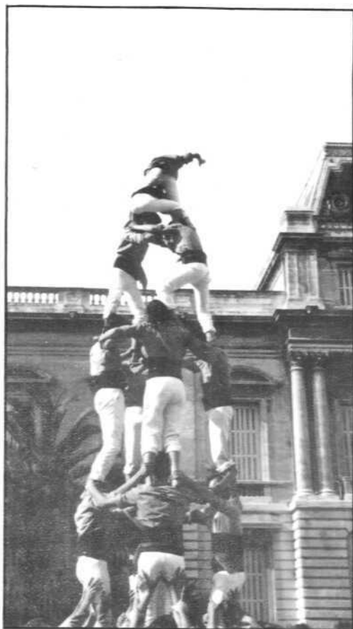
4 de 6 a la plaça de la Concorde de Montpeller

BATLLE M. BARDÀ, 22-24 TELÉFON 31 28 56 * REUS